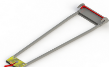
PA-550 FIJACION PARA CAMILLAS STRETCHER LOCKING SYSTEM SYSTÈME DE BLOCAGE DU BRANCARD