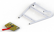
PA-535 FIJACION PARA CAMILLAS STRETCHER LOCKING SYSTEM SYSTÈME DE BLOCAGE DU BRANCARD