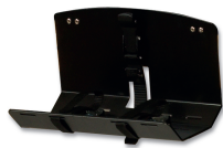
PA-532 PORTA BOTELLA DE OXÍGENO OXYGEN BOTTLE HOLDER OXYGÈNE PORTE BOUTEILLE