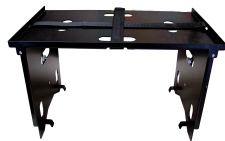
PA-610 MESA INSTRUMENTAL PLEGABLE INSTRUMENTAL FOLDING TABLE INSTRUMENTAL TABLE PLIANTE