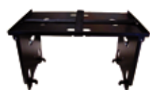
PA-610 MESA INSTRUMENTAL PLEGABLE INSTRUMENTAL FOLDING TABLE