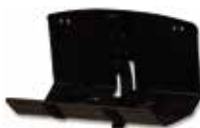
PA-525 PORTA BOTELLA DE OXÍGENO OXYGEN BOTTLE HOLDER