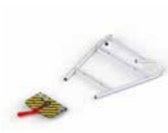
PA-535 FIJACION PARA CAMILLAS STRETCHER LOCKING SYSTEM SYSTÈME DE BLOCAGE DU BRANCARD