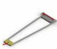
PA-550 FIJACION PARA CAMILLAS STRETCHER LOCKING SYSTEM SYSTÈME DE BLOCAGE DU BRANCARD