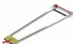
PA-550 FIJACION PARA CAMILLAS STRETCHER LOCKING SYSTEM SYSTÈME DE BLOCAGE DU BRANCARD