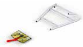
PA-535 FIJACION PARA CAMILLAS STRETCHER LOCKING SYSTEM SYSTÈME DE BLOCAGE DU BRANCARD