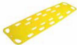
PA-06 TABLERO ESPINAL ESTANDARD STANDARD SPINE BOARD PLANCHE DORSALE STANDARD