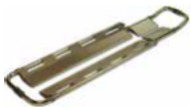
PA-05 CAMILLA PALAS EN ALUMINIO ALUMINIUM SCOOP STRETCHER CULLAIRE EN ALUMINIUM