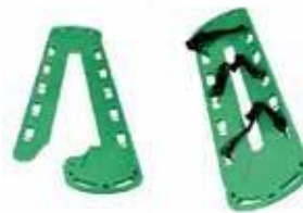
PA-179 CAMILLA PALAS Y TABLERO ESPINAL SPINE BOARD AND SCOOP STRETCHER PLANCHE DORSALE ET CIVIERE SCOOP