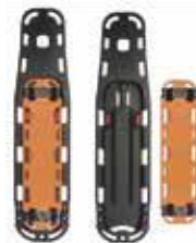
PA-252 TABLERO ESPINAL ADULTO Y PEDIÁTRICO ADULT AND PEDIATRIC SPINE BOARD PLANCHE DORSALE ADULTE ET PEDIATRIQUE