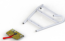
PA-535 FIJACION PARA CAMILLAS STRETCHER LOCKING SYSTEM SYSTÈME DE BLOCAGE DU BRANCARD