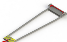
PA-550 FIJACION PARA CAMILLAS STRETCHER LOCKING SYSTEM SYSTÈME DE BLOCAGE DU BRANCARD