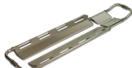
PA-05 CAMILLA PALAS EN ALUMINIO ALUMINIUM SCOOP STRETCHER CULLAIRE EN ALUMINIUM