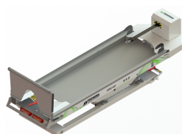
PA-490 CONJUNTO CABRESTANTE WINCH SET