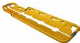
10-XLP CAMILLA PALAS RADIOTRANSARENTE SCOOP STRETCHER X-RAY INVISIBLE