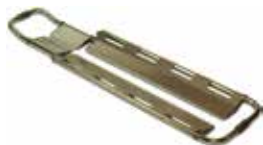
PA-05 CAMILLA PALAS EN ALUMINIO ALUMINIUM SCOOP STRETCHER