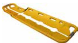
10-XLP CAMILLA PALAS RADIOTRASPARENTE SCOOP STRETCHER X-RAY INVISIBLE