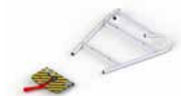
PA-535 FIJACION PARA CAMILLAS STRETCHER LOCKING SYSTEM