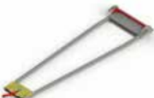
PA-550 FIJACION PARA CAMILLAS STRETCHER LOCKING SYSTEM