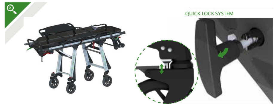
QUICK LOCK SYSTEM